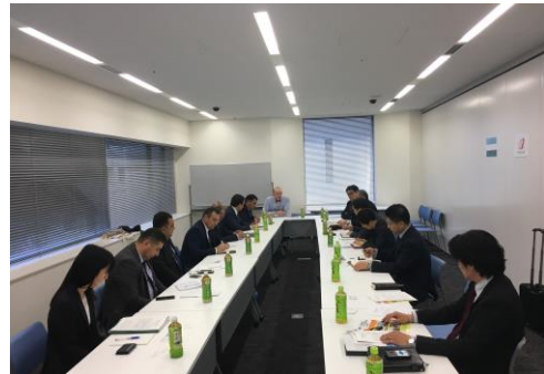
日本企業との面談