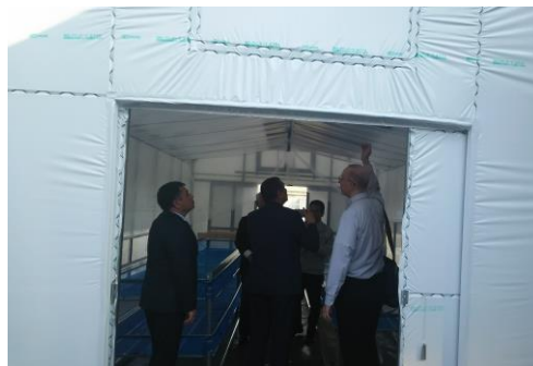
温室パイプハウス見学